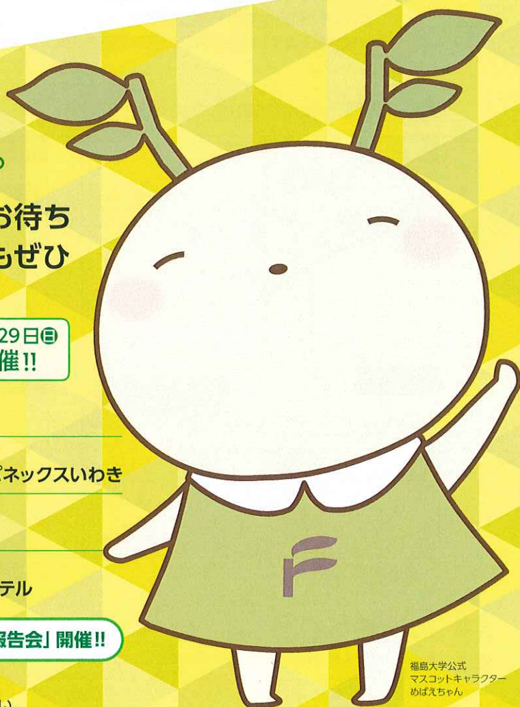
福島大学公式 マスコットキャラクター めばえちゃん

各会場とも60分前に開場します。 状況により前後する場合がございますので、予めご了承ください。